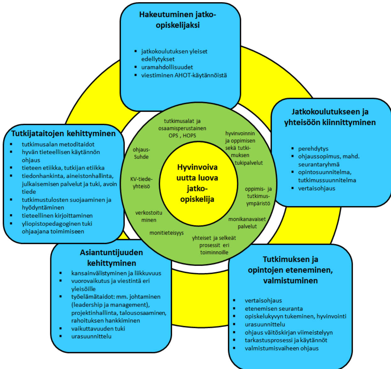
Kuva 2: Tampereen yliopiston jatko-opintojen ohjaus tavoitteiden ja toimintojen näkökulmasta. Kuvan vihreä osuus tuo esille perusedellytykset, jotka tavoitteiden saavuttaminen edellyttää.